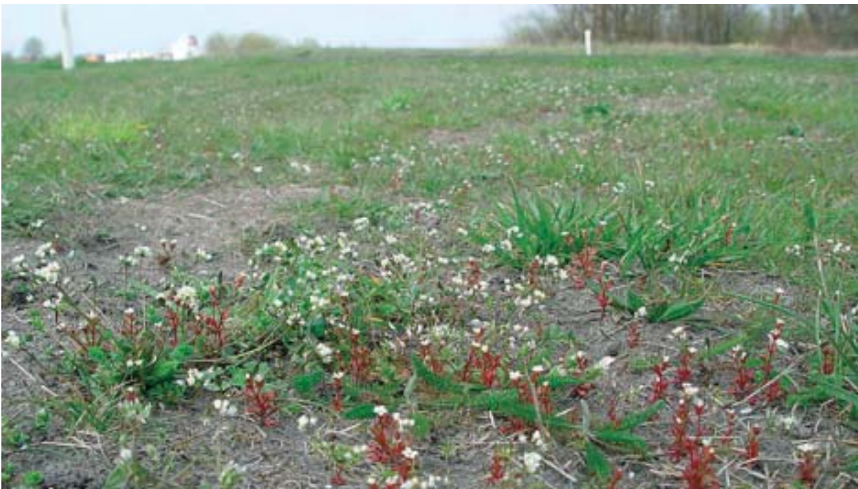
Foto 3: Bij het leggen van een nieuwe leiding is op deze leidingstrook een kale strook grond ontstaan. Meteen verschijnen er grote aantallen pioniersoorten, zoals hier kandelaartje en vroegeling.

Voorbeelden: strandplevier, bontbekplevier, kleine plevier, dwergstern, visdief, rugstreppad, smal vlieszaad en kandelaar.