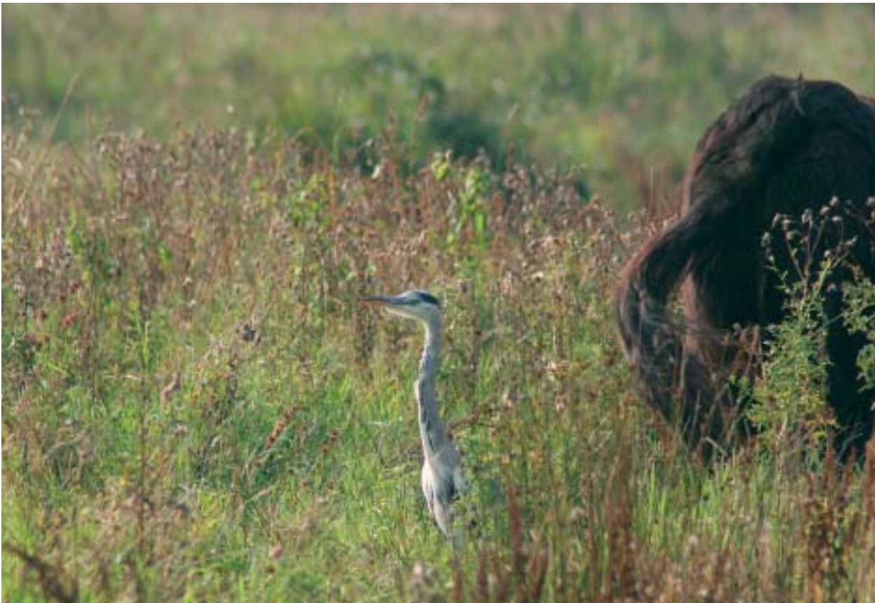
Foto 12: Reigers en roofvogels profiteren direct van het toegenomen aanbod aan muizen in ruige bloenrijke graslanden.

Afhankelijk van de bestaansperiode van een tijdelijk natuurgebied zijn er tal van soorten, vooral de echte pioniers, die al ruimschoots vertrokken zijn voordat de bulldozer zijn werk komt doen. Maar ook zo'n kort verblijf is voor de populatie als geheel van grote betekenis. Pionierplanten sturen na één geslaagd seizoen enorme aantallen zaden de wereld in. Amfibieën kunnen duizenden nakomelingen de wijde wereld in laten trekken na een geslaagde voortplanting. Vogels doen het wat rustiger aan, maar ook daarvoor geldt dat één geslaagd broedseizoen bijdraagt aan een grotere populatie het volgende jaar. Net als pioniersoorten, kunnen ook tal van vroege soorten al voor een definitieve inrichting reeds verdwenen of in aantal verminderd zijn. De winst van een tijdelijk natuurgebied zit hem in al die zaden en nakomelingen die zich naar de wijde omgeving verspreid hebben. En natuurlijk ook in de belevingswaarde die zo'n gebied heeft voor de mensen die er van willen genieten. Want hoewel dat buiten het bestek van deze studie valt, is ook dat een belangrijk aspect.