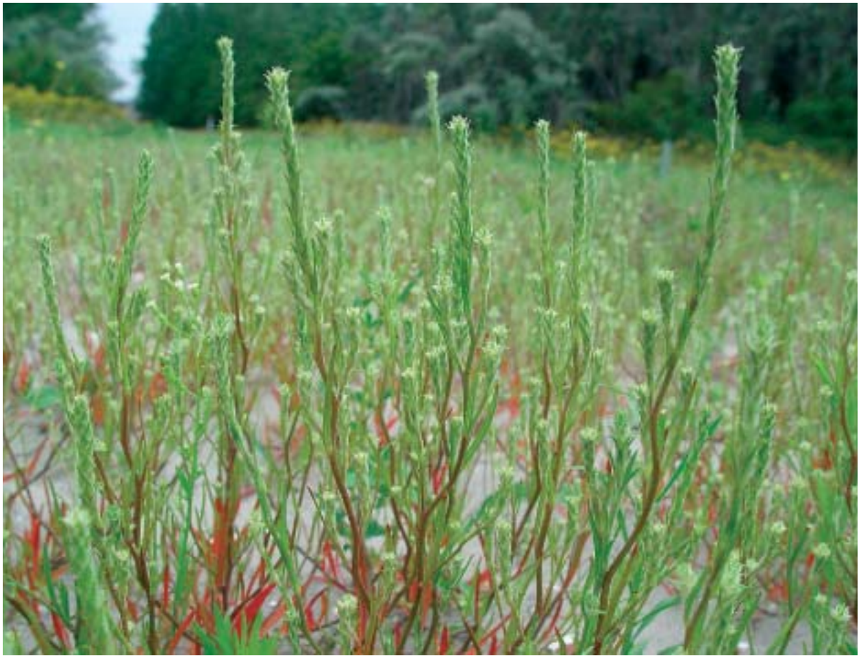
Foto 2: Sommige soorten, zoals smal vlieszaad, zijn juist te vinden op industrieterreinen die regelmatig op de schop gaan.